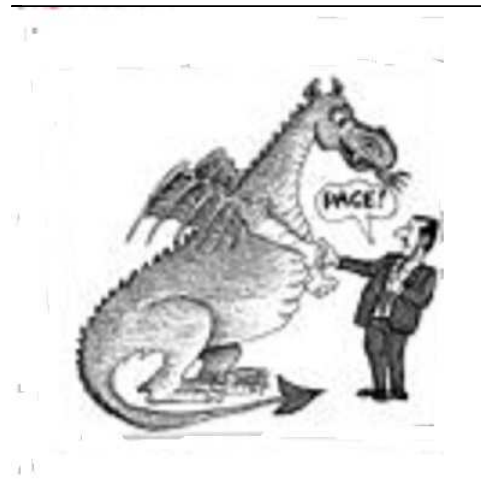
Vignetta di Giannelli - Corriere della Sera - 9/10/21